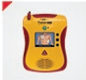
DAE DE FORMATION